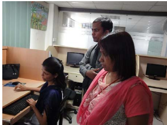
Dhaka: dienstverlening op grafisch gebied