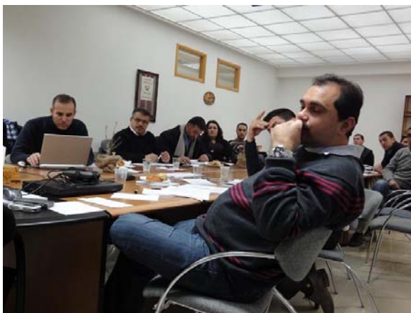
Ramallah (Palestina): IT-training