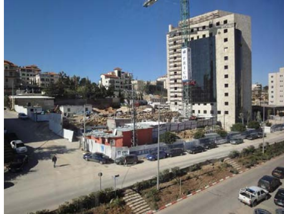
Ramallah: bouw nieuw (IT)-kantoorgebouw