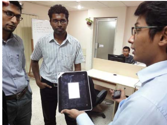
Dhaka: ontwikkelaars van iPad applicaties