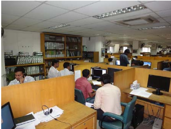
Dhaka: software ontwikkelaars